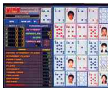
※画面写真は FM-TOWNS 版“VIPS”